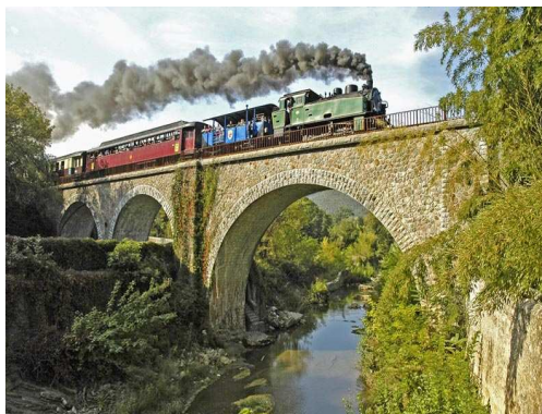
Train à vapeur des Cévennes